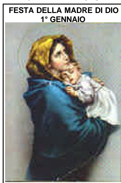
FESTA DELLA MADRE DI DIO 1° GENNAIO

ed è un grande dono, una proprietà da sfruttare e usare bene o da dissipare o sciupare. - Comunque sia,