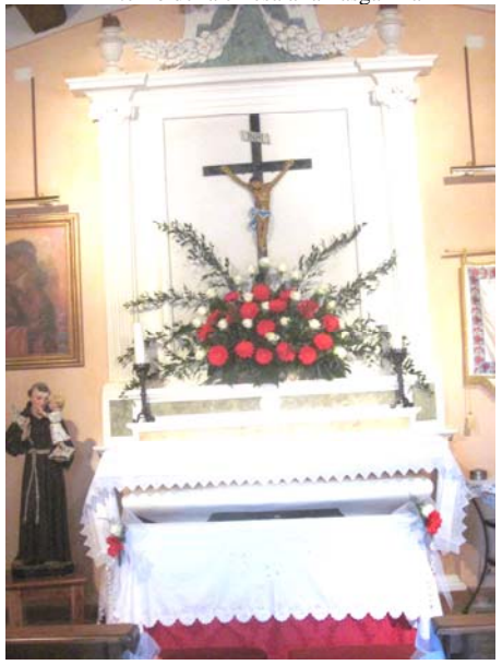
L'interno della chiesa alla Pasganina

E' stato celebrato nella chiesetta di S. Antonio di Padova alla Paganina qui a Montecastelli, una chiesa che ormai quasi tutti conosciamo anche se alcuni l'hanno vista solo in fotografia qui sul "notiziario" o nei manifesti che più volte sono stati affissi quando abbiamo organizzato "feste" per racimolare qualche soldo al fine di poter restaurare quella chiesa. Lo Sposo un giovane di Montecastelli Pisano, della nostra