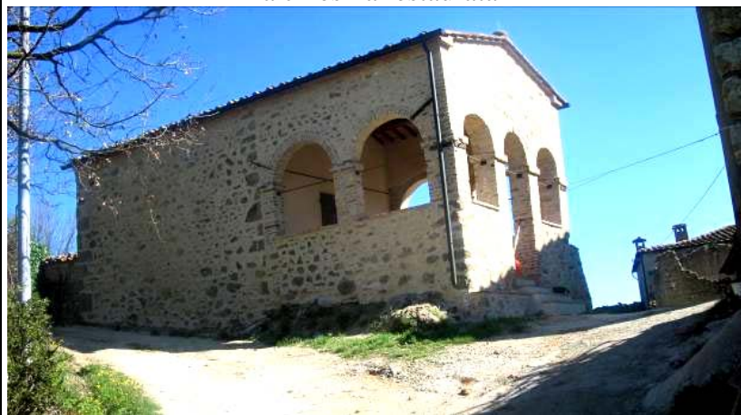
La chiesina restaurata

“Comitato per il restauro” , del Sindaco, dell’Architetto e di tanti amici, amiche e Benefattori che in questi anni con entusiasmo hanno sostenuto quest’opera, la “Chiesina” viene “riconsegnata” al culto del Signore e alla venerazione di Sant’Antonio di Padova in questa contrada della Paganina.