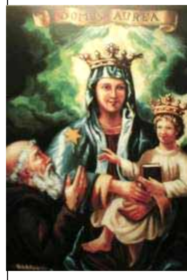
MADONNA DELLA CASA