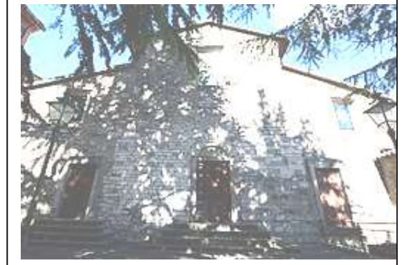
Chiesa di Castelnuovo di Val di Cecina

parliamo della recente Festa della Madonna ricordando qualche particolare, una festa e che è stata particolarmente bella e significativa, un segno di Fede e di devozione di tante persone che vi hanno partecipato. La Madonna, con la sua Immagine, ha richiamato tante persone al centro del Paese e col camminare della Processione, le ha condotte in chiesa da Gesù. Il compito della Madonna è proprio quello