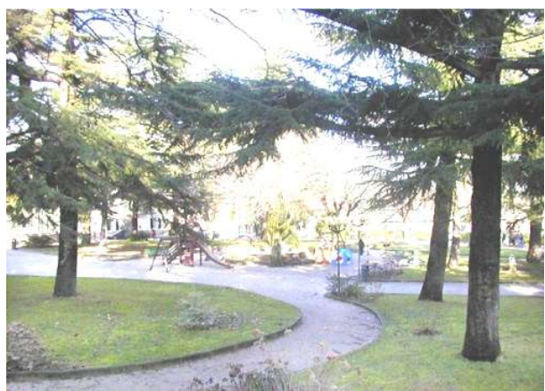
Castelnuovo Val di Cecina: il "Piazzone"

di "dare Gesù" e di "condurre a Lui". Preghiere, canti, commenti appropriati e il suono della Banda hanno accompagnato il cammino. La Processione ha fatto sosta nei Giardini pubblici detti "Il Piazzone" e lì è stato letto un "Pensiero" che ha spiegato il motivo di quella sosta. Le parole furono queste: