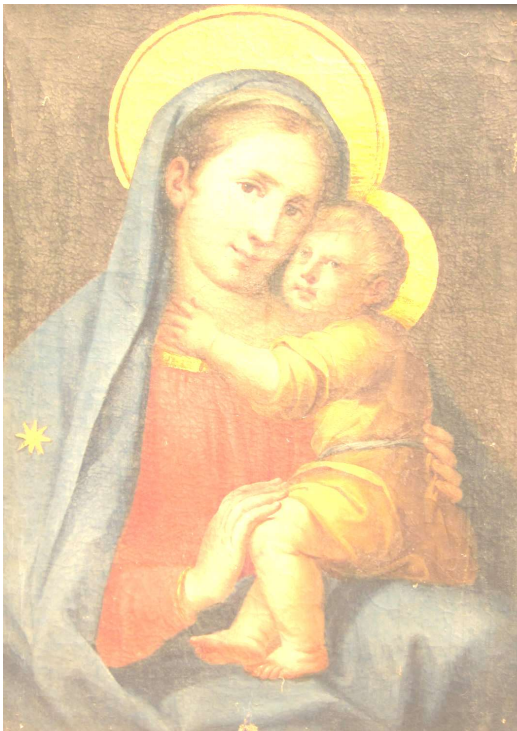
Consolaci e aiutaci

"Immacolata Vergine Maria, Madre di Dio e madre nostra, pieni di fiducia ci presentiamo davanti a te e invociamo la tua materna protezione. Dalla Chiesa sei proclamata Consolatrice degli afflitti e a te continuamente ricorrono i sofferenti nel corpo e nello spirito, i poveri nelle loro necessità materiali, i moribondi nell'agonia, e tutti da te ricevono consolazione e conforto.