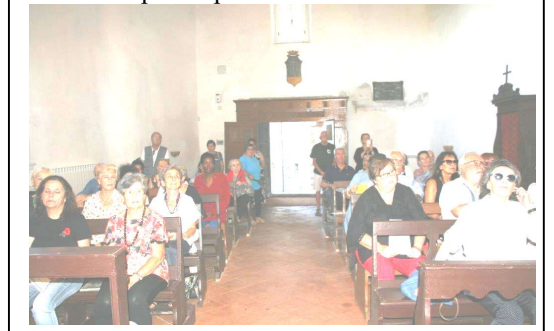
La partecipazione alla S. Messa