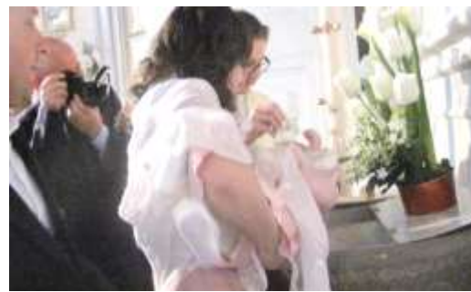
Momento del Battesimo

"grande famiglia dei figli di Dio" che è la Chiesa.