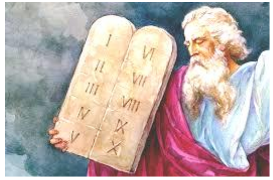
Mosé e le "Tavole della Legge": i 10 comandamenti

Se la nostra vita concreta manifesta il nome di Dio, allora si vede quanto importante il Battesimo e che grande dono è l'Eucaristia! Quale sublime unione ci sia fra il nostro corpo e il Corpo di Cristo: Cristo in noi e Lui in noi e noi in Lui! Uniti! Questa non è ipocrisia, questa è verità. Questo non è parlare o pregare come un pappagallo, questo è pregare con il cuore, amare il Signore. "Dio non dirà mai di 'no' a un cuore che lo invoca sinceramente".