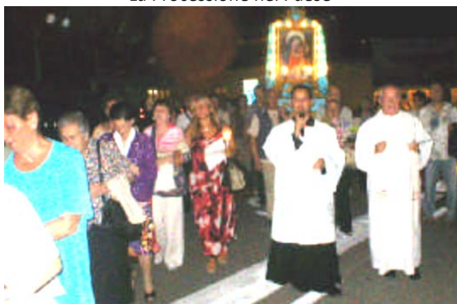
La Processione nel Paese

E' vero che sarà "solo una Immagine Benedetta ", molto bella e antica, ma nell'intenzione nostra e nei nostri pensieri sappiamo e ci sentiamo come se la Madonna in persona passasse tra noi".