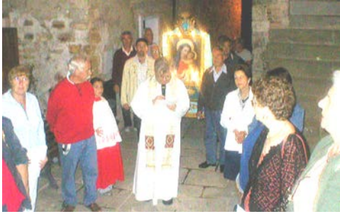
La Processione in Borgo

far partire la Processione della Madonna da varie parti del Paese per andare verso la chiesa: dal “Canale”; dalla piazza in via della Serretta; dai Lagoni; da Riarnoli; dall'inizio di via Martiri di Niccioleta; dall'incrocio di Via Trento e Trieste con Via Carducci; dalla cima di Via M. Buonarroti; dal Borgo e nel Borgo, ove l'Immagine della Vergine sostava tutto il sabato nella chiesa del Borgo. In quella sera si celebrava la Messa festiva, invece che nella chiesa parrocchiale. Bellissimi ricordi che fanno bene ancora, soprattutto a chi li ha vissuti!! Quel portare l'Immagine della Madonna a percorrere, pian piano quasi tutte le vie di Castelnuovo , è stato sempre il segno della Madonna che è andata a cercare di portare da Gesù la “Gente di Castelnuovo” e tutti