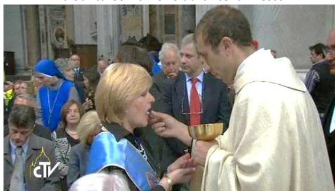
La Santa Comunione durante la Messa

La Messa non si paga, essa è il sacrificio di Cristo che è gratuito. Se tu vuoi fare l'offerta, falla ma la Messa non si paga".