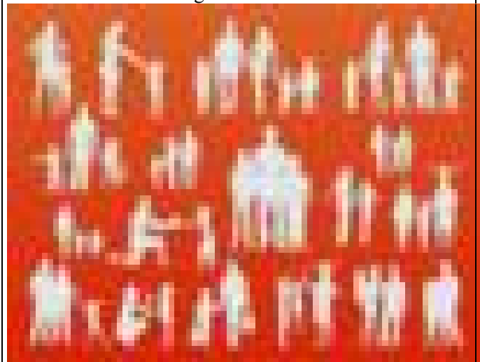
Tante famiglie...una Parrocchia

A Cana, c'era la Madre di Gesù, la "madre del buon consiglio". Ascoltiamo anche noi le sue parole: "Fate quello che vi dirà" Care famiglie, care comunità parrocchiali , lasciamoci ispirare da questa Madre, facciamo tutto quello che Gesù ci dirà, e ci troveremo di fronte al miracolo, al miracolo di ogni giorno!. Grazie- (9 sett.2015)