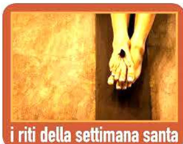
i riti della settimana santa

Questi Oli verranno adoperati in tutto l'anno per i Sacramenti del Battesimo, della Confermazione, delle Ordinanze sacerdotali e dell'Unzione degli Infermi. Durante la Messa crismale, avviene anche il rinnovo delle promesse sacerdotali. Nel mondo intero, ogni sacerdote rinnova gli impegni che si è assunto nel giorno dell'Ordinazione, per essere totalmente consacrato a Cristo nell'esercizio del sacro ministero a servizio dei fratelli.