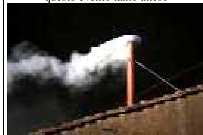
La prima “apparizione di Papa Francesco

Le campane della nostra chiesa hanno suonato a lungo unendosi a quelle di S. Pietro e dei tutto il mondo per salutare questo evento tanto atteso