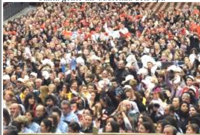
Tanta gente all’udienza del Papa