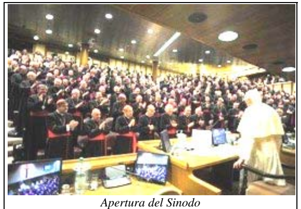
Apertura del Sinodo

*****Il discorso è lungo e complesso. In sostanza dice il Sinodo, la “chiave di volta” della nuova evangelizzazione sta proprio nel passare da una pastorale passiva e di mera conservazione a una pastorale intrepida, di missione permanente, che veda sacerdoti e laici testimoniare con coraggio ed entusiasmo il Vangelo -