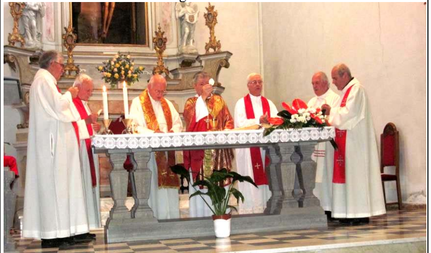
Card. Angelo Bagnasco