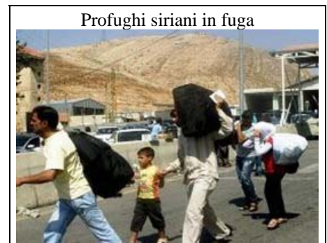
Profughi siriani in fuga

La dichiarazione del Ccee quindi conclude: «Siamo certi che, con l’aiuto di Dio, il buon senso può prevalere e recare una convivenza pacifica nella verità, nella giustizia, nell’amore, nella libertà e nel rispetto di tutte le minoranze, in particolare dei cristiani del Paese».