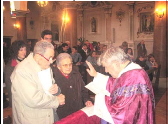
Il momento della particolare Benedizione

nemmeno quella per affermare il « consta che non », (« risulta che non sono ») espressione usata per smentire fenomeni ritenuti sicuramente fasulli.