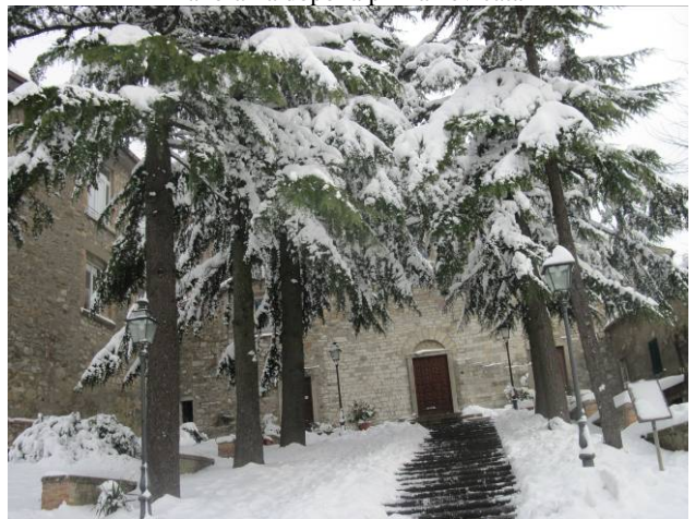
Panorama dopo la prima nevicata

Guardando la televisione vediamo in varie regioni situazioni ben più gravi della nostra, ma anche noi siamo messi abbastanza male!...Dopo la nevicata di 10 giorni fa e con un freddo straordinario, nella notte tra giovedì 9 e venerdì 10 Febbraio ha ricominciato a nevicare ed è continuato ininterrottamente fino a circa le ore 12 del del giorno 11 febbraio. .: