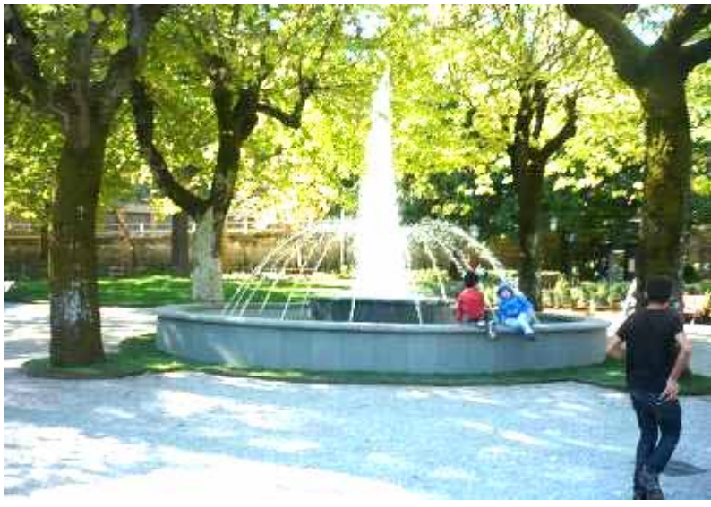
La “Nuova Fontana”