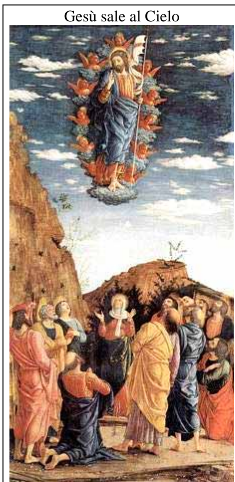
Gesù sale al Cielo

Con quel giorno inizia e deve iniziare un nuovo e diverso "cammino di vita"! →