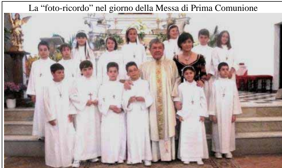
La "foto-ricordo" nel giorno della Messa di Prima Comunione

Quando si esce di chiesa comincia l'impegno nel mondo, nel nostro paese, nella società in