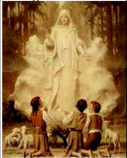
Prima apparizione della Madonna

Verso mezzogiorno, dopo aver recitato il rosario, come facevano di solito, si intrattennero a costruire una piccola casa con pietre raccolte sul luogo, dove oggi sorge la Basilica. - All'improvviso videro una grande luce; e pensando che si trattasse di un lampo di un temporale imminente, decisero di andarsene, ma sopraggiunse un altro lampo che illuminò il luogo e videro sopra un piccola piata di elce una "Signora più splendente del sole" dalle cui mani pendeva un rosario bianco. La Signora disse ai tre Pastorelli che era necessario pregare molto e li invitò a tornare alla Cova da Iria :