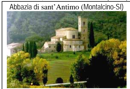
Abbazia di sant'Antimo (Montalcino-SI)

La PRIMA INIZIATIVA è promossa dal Circolo Culturale "Il Chiassino" con la collaborazione della nostra Parrocchia e si tratta di un "CONCERTO DI CANTI GREGORIANI e di alcuni brani di POLIFONIA RINASCIMENTALE". Questo Concerto che si inserisce bene, per il suo genere, nell'"atmosfera quaresimale e pasquale" che stiamo vivendo come cristiani, si terrà nella nostra chiesa parrocchiale nel pomeriggio del 10 Aprile alle ore 18, ad opera del "CORUS ANTHIMI" dell'Abbazia di Sant'Antimo, vicino a Montalcino (Siena). Domenica prossima sarà pubblicato il programma del concerto e altri particolari, mentre ora