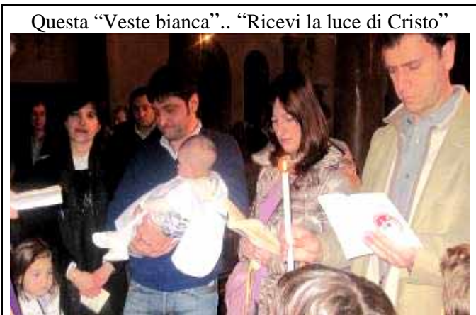
Questa “Veste bianca”.. “Ricevi la luce di Cristo”