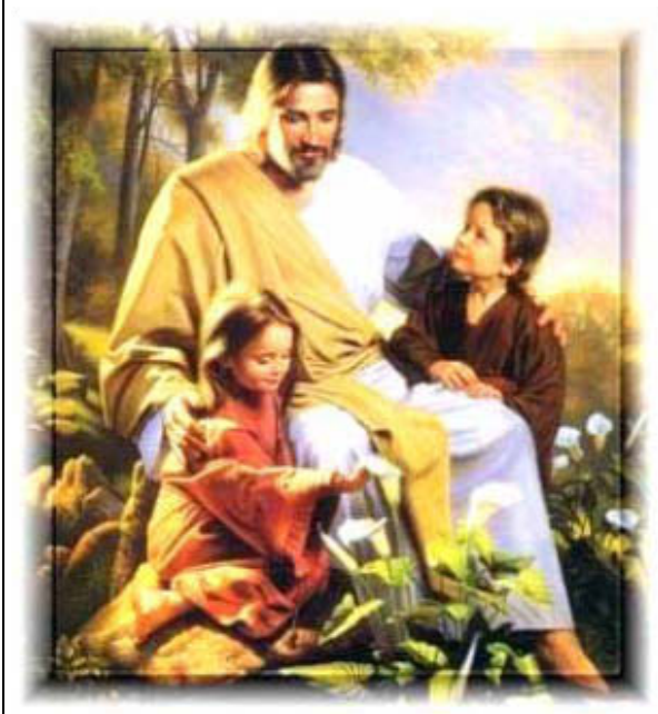
Fanciulli intorno a Gesù

c'è anche l'" anno catechistico " che inizia proprio oggi , un cammino da percorrere insieme, fanciulli, genitori, sacerdote e catechiste. Il Catechismo è un cammino durante il quale si impara ad essere cristiani come ci desidera Gesù nella vita in famiglia, a scuola, nel paese e nella vita della Parrocchia . La vita della Parrocchia è caratterizzata per fanciulli, ragazzi e ragazze da due impegni particolari: la partecipazione alla S. Messa della domenica e al Catechismo settimanale .