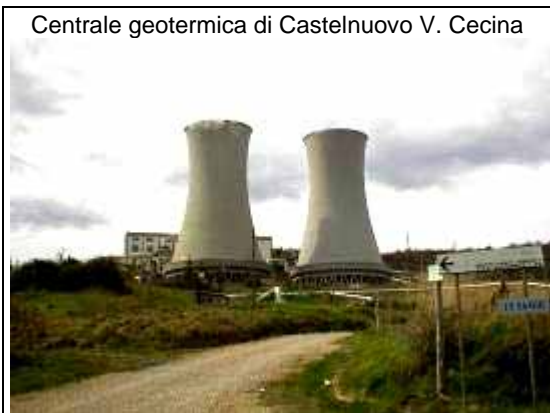
Centrale geotermica di Castelnuovo V. Cecina