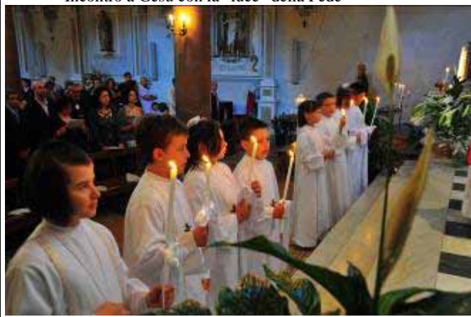
Incontro a Gesù con la "luce" della Fede