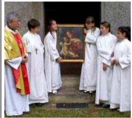
La “Madonna del Piano” nella sua festa

Allora: oggi, domenica 30 Maggio, la messa pomeridiana non sarà celebrata nella chiesa parrocchiale ma alla Madonna del Piano. Al termine della messa si farà la Processione sul piazzale, e l’Immagine della Madonna sarà portata dai bimbi e dalle bimbe della Prima Comunione che parteciperanno, insieme alla gente, con le loro famiglie