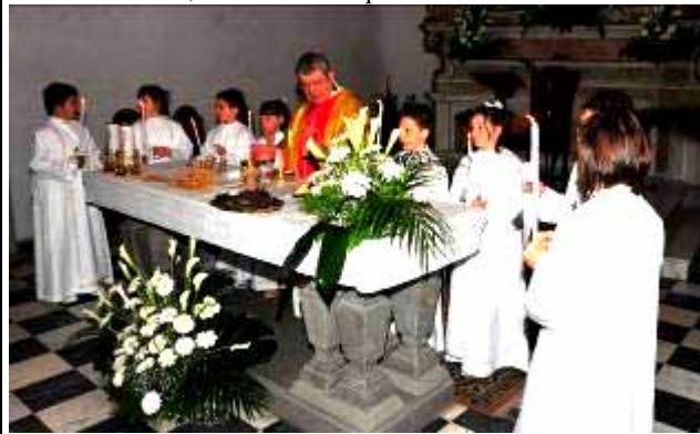
Intorno all'altare, la mensa sulla quale scenderà Gesù.....