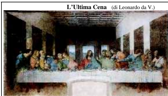
L'Ultima Cena (di Leonardo da V.)

Il Giovedì, il Venerdì e il Sabato Santo sono i giorni del "Solenne Triduo Pasquale"