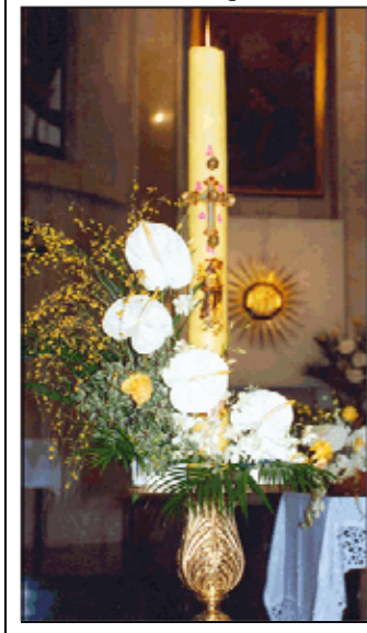
Il Cero Pasquale

Anche la preghiera dei cristiani si fa silenziosa ed è carica soprattutto di attesa: attesa di rivivere ciò che cambiò profondamente ogni storia e ogni cosa. - Certo, sappiamo bene che la Pasqua è un fatto avvenuto "una volta per tutte": sappiamo che Cristo ormai risorto non muore più; e tuttavia siamo chiamati a vivere questo giorno di silenzio e di attesa accogliendo e vivendo nella Fede il grande messaggio: il Signore crocifisso è vivente in mezzo a noi.