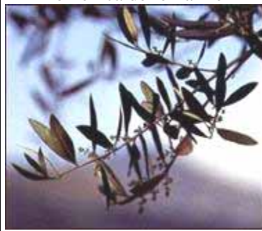
Domenica delle Palme

Tra quindici giorni saremo a Pasqua- Quindi domenica prossima sarà la "Domenica delle palme".