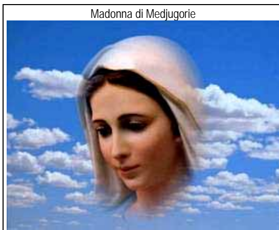
Madonna di Medjugorje