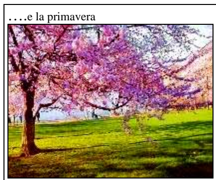
...e la primavera

L'equinozio è il momento in cui la notte e il giorno sono ugualmente di 12 Ore e segna il passaggio dall'inverno alla stagione più mite dell'anno.