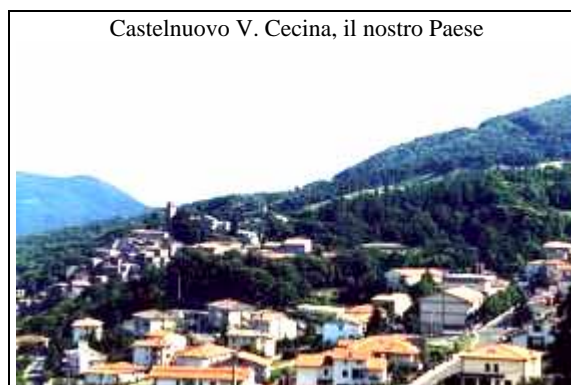
Castelnuovo V. Cecina, il nostro Paese

L' "impaginazione" del giornale spetta alla Redazione dello stesso. Nel comporle e nello stamparlo speriamo che facciamo un bel lavoro, perché per preparare questo "servizio" noi ci abbiamo messo tanta cura e molto impegno. Ne verranno ordinate molte copie che saranno a disposizione di TUTTI in chiesa, a un prezzo ridotto rispetto al normale