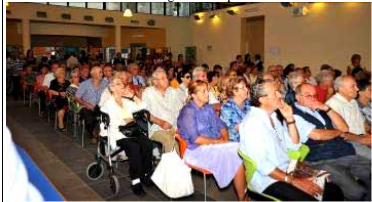
La "Pista" gremita di persone