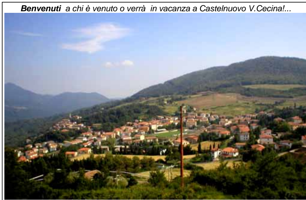
Benvenuti a chi è venuto o verrà in vacanza a Castelnuovo V. Cecina!...

Siamo giunti all'estate, che è per molti il tempo delle ferie e delle vacanze. Luglio e Agosto sono mesi di vacanza. Una volta la gente benestante partiva per la "villeggiatura". Poi sempre più persone e famiglie hanno conosciuto la serenità di un periodo di