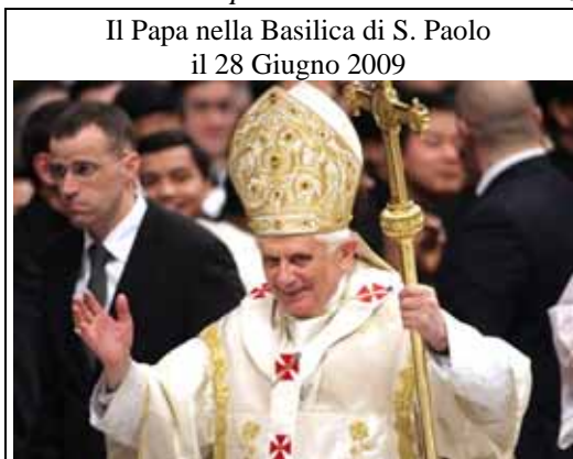
Il Papa nella Basilica di S. Paolo il 28 Giugno 2009