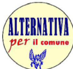
LISTA N° 3

Tra quindici giorni andremo a "votare" per le elezioni Europee, Provinciali e Comunali. Pur essendo importanti, le elezioni Europee e Provinciali, non è possibile qui scendere nei particolari e pubblicare in questo poco spazio un servizio che illumini un panorama così vasto. Ognuno conosce i simboli dei partiti e si regoli informandosi prima e osservando bene dov'è il simbolo del partito che intende votare. Se mai è possibile dare informazioni più particolareggiate