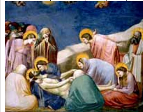
Gesù è deposto nel sepolcro (Giotto)

°°° ORE 11, 15: Inizio della Veglia Pasquale a Castelnuovo: Benedizione del fuoco fuori della chiesa, accensione del Cero pasquale , Benedizione del Fonte Battesimale, Prima Messa di Pasqua.