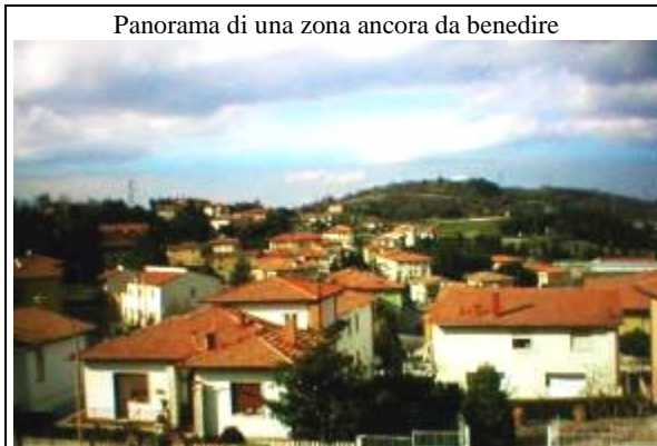
Panorama di una zona ancora da benedire

Procedono regolarmente le "Benedizioni Pasquali", secondo il calendario previsto. Per me è una grande "faticata" a causa dell'accentuato disagio che provo a salire e a scendere tante scale, per far visita alle famiglie; ma è anche una "consolazione" poter incontrare tante persone nell'intimità della loro casa, e portare a tutti il "segno" dell'amore di Dio che è la Benedizione e recare anche mia personale vicinanza alle gioie e alle prove delle famiglie. - Celebrando la S. Messa al mattino, quest'anno posso disporre nel pomeriggio di un po' più di tempo che negli anni scorsi e così fare dei brevi... riposi e soprattutto ricercare l' "ascolto" e il "dialogo" come sacerdote, con tante persone che mi attendono e mi accolgono, vivendo poi con me il momento della Preghiera. d. S.