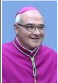
Mons. Luigi Negri Vescovo di San Marino-Montefeltro

Com'è stato efficacemente ricordato in questo dibattito, l'indisponibilità della vita è la radice di una autentica convivenza civile e quindi è la radice di una autentica democrazia. Ma l'aspetto più inquietante è quello che non emerge e su cui non c'è l'attenzione dei mezzi della comunicazione sociale: decisioni di questo tipo che attaccano la radicalità della vita e i diritti fondamentali dell'uomo ormai sono presi dalla Magistratura, che si è autoinvestita di essere il soggetto etico e culturale supremo, indiscusso e indiscutibile della vita sociale. Conclude Mons. Negri: ogni tanto alcuni vedono un pericolo per la democrazia nel nostro Paese in fatti o enfattizzati o addirittura inesistenti, ma non si rendono conto che la democrazia può finire per questo potere della Magistratura di intervenire ad ogni livello della vita sociale senza alcuna verifica delle sue decisioni, mostrando, nella maggior parte dei casi, che i principi di queste decisioni, come nel caso di Eluana Englaro, sono principi che risalgono alla più radicale mentalità laicista, tecnoscientifica e quindi anticattolica.