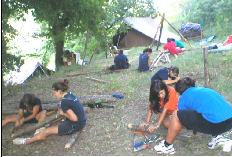
Vita al Campo degli Scout: ragazze..."super impegnate!..."