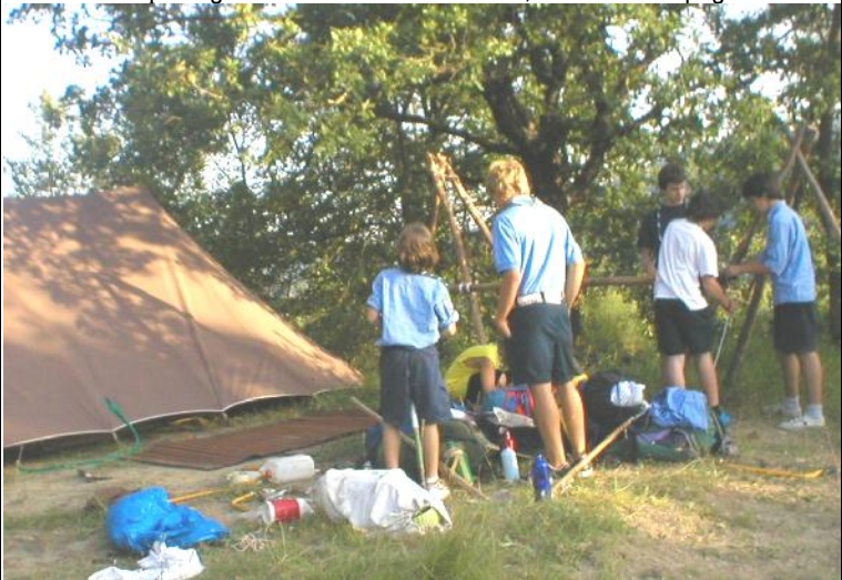
Vita di Campo: ogni scout sa che tutto riuscirà, se ci sarà l'impegno di tutti