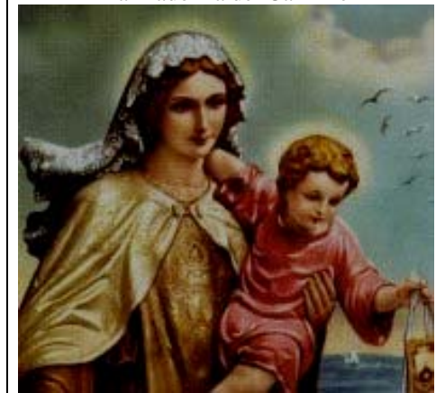
La Madonna del Carmine