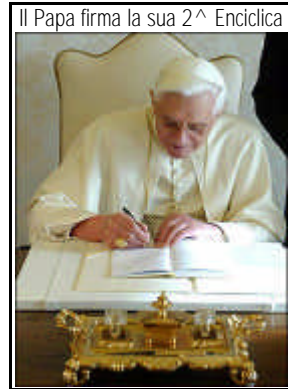
Il Papa firma la sua 2^ Enciclica

Oggi sono pochi coloro che apprezzano questo immenso dono di Dio, e troppi ripongono la loro fiducia solo nelle possibilità degli uomini. "La redenzione, dice il Papa, è stata convertita in emancipazione, opera dell'uomo che