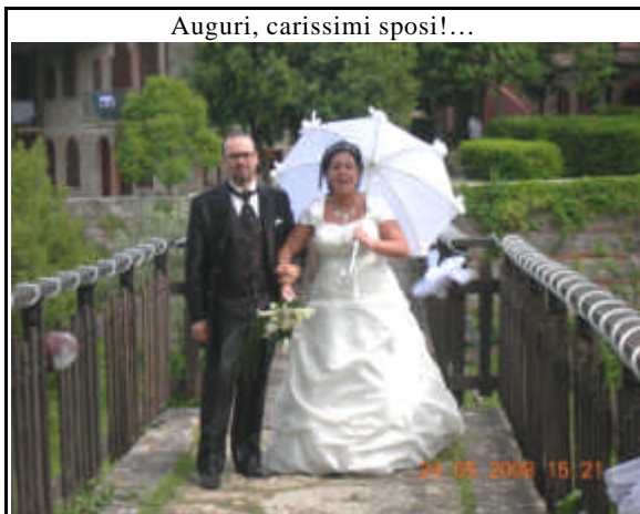
Auguri, carissimi sposi!...

(Per un inconveniente tecnico non posso avere ancora le foto che feci fare in chiesa. Metto questa, altrettanto bella, inviata da un amico che voglio ringraziare. Appena possibile rimedierò prossimamente- d. Secondo.)