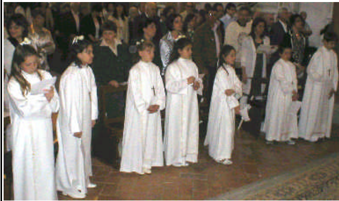
L'Assemblea dei Fedeli con i Fanciulli alla Messa della Prima Comunione