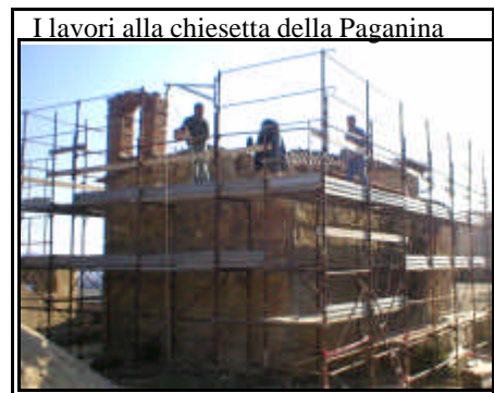
I lavori alla chiesetta della Paganina

Alla "Paganina" c'è una bella chiesetta che fino a poco tempo fa "dava tanta tristezza" perché era ridotta proprio a un rudere. Col consenso del Parroco (che sono io), è stato fatto un "Comitato" di abitanti del luogo e di amici e tutti si sono dati da fare per cercare delle "finanze" e veder così di salvare" la chiesetta...Ci si è quasi riusciti!!! - E' stato rifatto il tetto e ora la chiesa non è più nel pericolo di franare definitivamente... Però i lavori costano tanto, o occorre mobilitarsi in tutti i modi per trovare altri...amici!...A tal fine è stata organizzata per oggi 4 Maggio una festa sull'aia ": si tratta solo di una festa all'insegna di un pranzo insieme ", per vedere ciò che è stato fatto e, se dal pranzo ci rimarrà.." qualche spicciolo", sarà adoprato " pro chiesa della Paganina ", in attesa, a lavori completati di fare anche una solenne " festa religiosa "