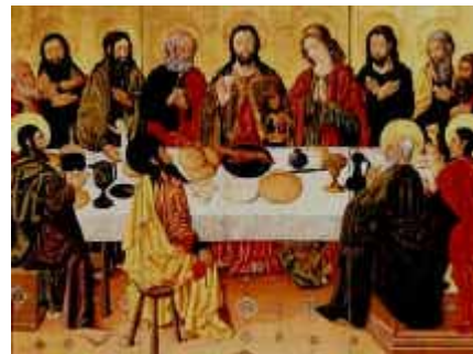
L'Ultima Cena fu la Prima Messa della storia

La domenica è giorno festivo, il "giorno del Signore": in questo giorno i veri cristiani rivivono la Risurrezione di Gesù, partecipando alla S. Messa, ricevendo la S. Comunione, riunendosi come "popolo di Dio". La domenica è anche il "giorno dell'uomo", che astenendosi dal lavoro non necessario, si riposa e vive la gioia della famiglia riunita. Fin dal tempo degli apostoli è stata vissuta dai cristiani come "Giorno del Signore", giorno di gioia e di festa per la Risurrezione di Gesù. -La gioia della domenica è caratterizzata e causata proprio dall'incontro con Gesù Risorto. Come avvenne alla sera di quella prima domenica, quando il Risorto apparve nel cenacolo e "i discepoli gioirono al vedere