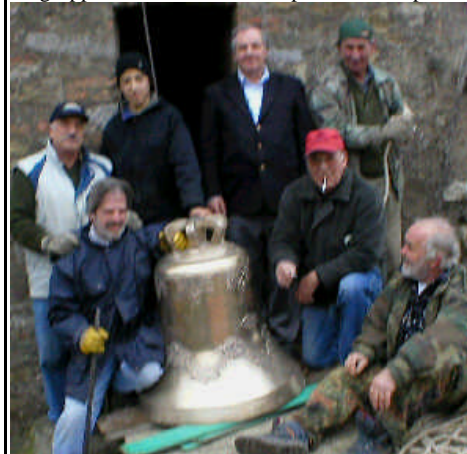
Il “gruppo” con Masi Idilio, ai piedi del campanile

(Si ripete anche quello già pubblicato domenica 20/01/08) Per i motivi spiegati domenica scorsa, comunico che quest’anno il “percorso” delle Benedizioni sarà più o meno come quello dell’anno scorso , con piccole varianti che si renderanno