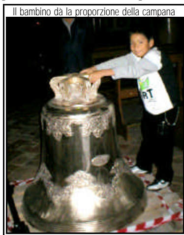
Il bambino dà la proporzione della campana

“Signore Dio onnipotente, ti preghiamo perché ti degni di + benedirli : fortifica il loro cuore nell'amore verso di Te; rendi bella, buona e santa la loro vita; infondi in essi il senso di un delicato rispetto per se stessi e per gli altri; guidali perché scelgano sempre la via del bene; mantienili sereni, forti e in salute; fa' che vogliano bene a Te e a tutti; con la forza della tua protezione difendi la loro virtù e liberali sempre dalle insidie diaboliche e della gente cattiva e perversa. Te lo chiediamo per Gesù Cristo tuo Figlio e nostro Signore. ( Parole tratte dalla Preghiera di Benedizione)