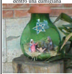
dentro una damigiana