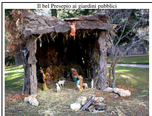
Il bel Presepio ai giardini pubblici

“Oggi si celebra la Giornata Missionaria Mondiale dei Ragazzi. Il Fanciullo Gesù è l'immagine e l'esempio perché tutti i fanciulli cristiani si impegnino ad aiutare la Chiesa nel suo compito di far conoscere Gesù e la sua parola scritta nel Vangelo, con la preghiera, con il sacrificio, con i gesti di bontà, e donando un'offerta da mandare ai Missionari per i bambini poveri e bisognosi. – In questo modo migliaia di bambini cristiani sparsi nel mondo, andranno incontro alle necessità di altri bambini, spinti da quell'amore che Gesù, il Figlio di Dio fattosi bambino, ha portato sulla terra”. Sono parole prese da un breve discorso che il Papa ha fatto per questa occasione. Il Papa ha anche ringraziato tutte le bambine e tutti i