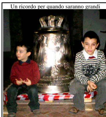
Un ricordo per quando saranno grandi

La campana “rotta” sarà calata dal campanile con i mezzi della Ditta OES , (vedremo come faranno!) e sarà portata o trasportata nel cortine dell'Asilo. La campana “nuova” dovrà essere tolta di chiesa e portata anch'essa nel cortile dell'Asilo. Come sarà fatto ciò? Così: con la collaborazione dell'ISOLVER