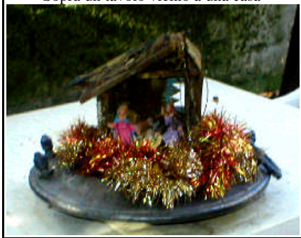
Sopra un tavolo vicino a una casa