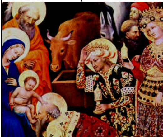
L'adorazione dei Magi

..Videro il bambino...e prostratisi lo adorarono