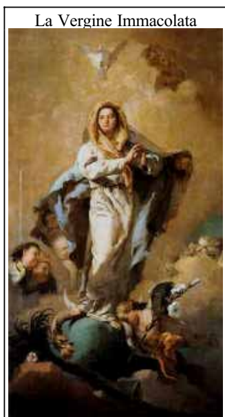
La Vergine Immacolata

1- Tota pulchra es Maria - Tutta bella sei, o Maria! -