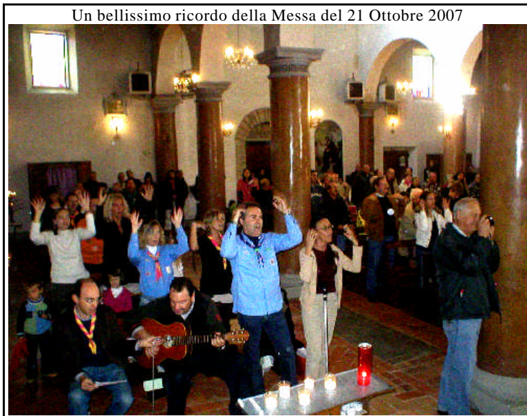
Un bellissimo ricordo della Messa del 21 Ottobre 2007

Giunto a sera, e ripensando al giorno trascorso, mi è venuta in mente la scena della "Trasfigurazione" narrata nel Vangelo, quando Gesù apparve così bello, così luminoso..., in mezzo a Mosè e al profeta Elia, e Pietro disse gli disse: "Maestro, come è bello stare qui!...Facciamo tre tende una per te, una per Mosè e una per Elia.... e stiamo sempre qui!..." Poi l' Evangelista commenta: "Per la grande gioia Pietro non sapeva quello che diceva!..."