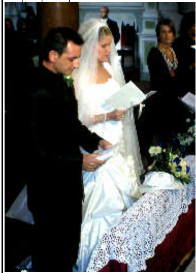
Gli sposi partecipano con Fede e devozione...

MA CHE COSA E' ACCADUTO DOMENICA SCOIRSA? (vedi a pag. due )