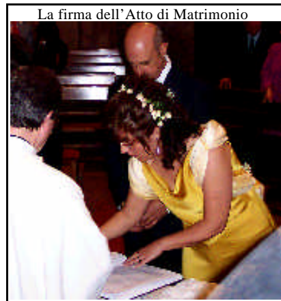
La firma dell’Atto di Matrimonio

DIAMO OGGI LA NOSTRA OFFERTA PER AIUTARE I MISSIONARI che sono partiti per portare il