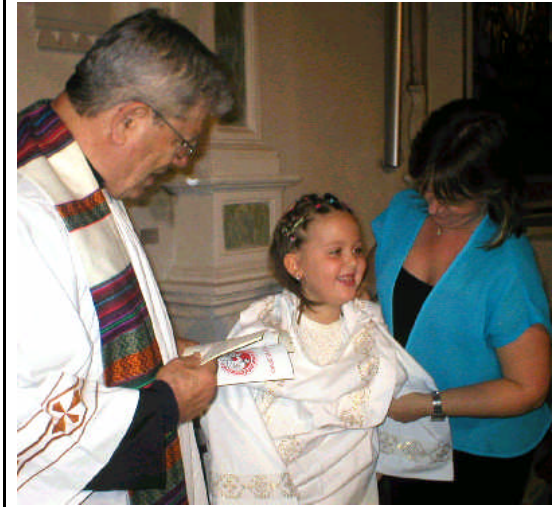
la Madrina rivesta Caterina della Veste Bianca

con devozione; chi non può durante la giornata ascolto dei suoi sicuri suggerimenti al suo cuore e alla sua coscienza.