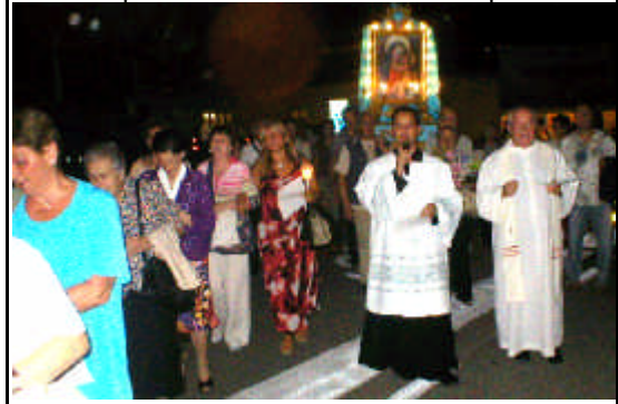
La processione del sabato sera in paese

Questi “signori” dovrebbero sapere (e lo sanno benissimo) che l'esenzione dall'I:C:I in alcuni casi particolari, riguarda le sedi