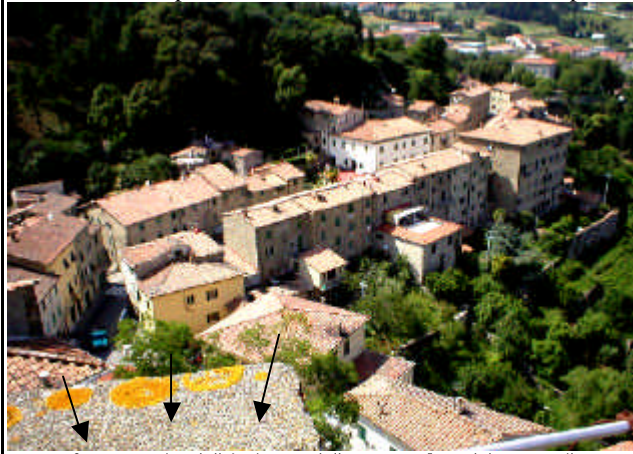
(foto eseguita dall'Arciprete dalla sommità del campanile ove è la Croce, in occasione dei recenti lavori di restauro della cima)

..chiederemo la protezione della Madonna sul nostro paese